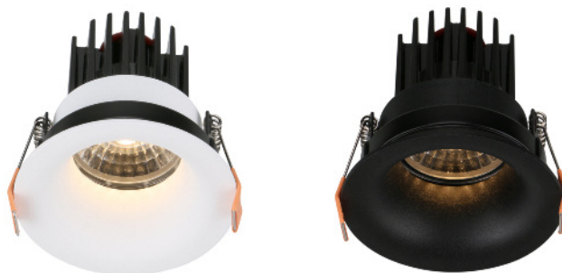
Exemple de collerettes assemblées avec lentille et module