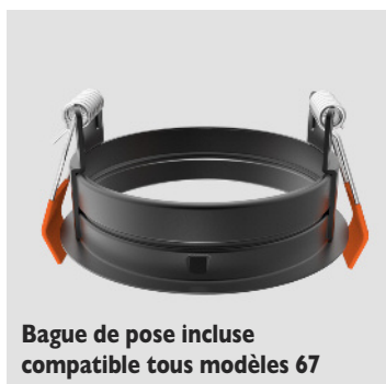
Bague de pose incluse compatible tous modèles 67