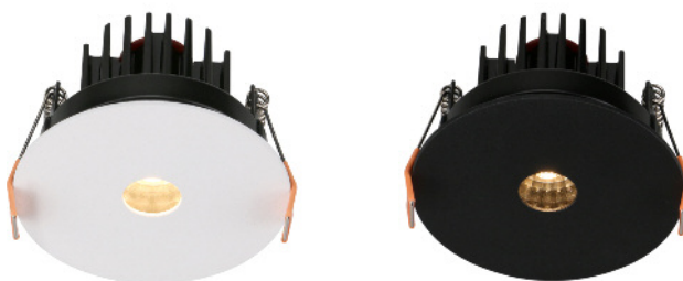
Exemple de collerettes assemblées avec lentille et module