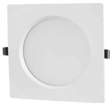
RING 230 FORME CARRÉE